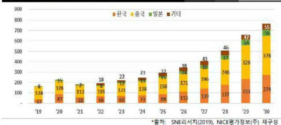
그림 6. 중장기 2차전지 생산 증설 전망