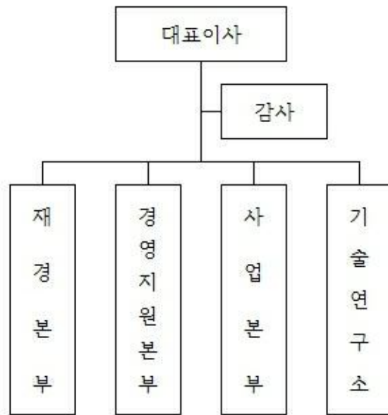
주식회사 영우디에스피 조직도