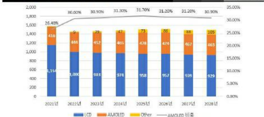
그림 6. 세계 디스플레이 시장 및 전망 (단위: 억 달러)

Omdia와 한국디스플레이산업협회(KDIA)에 따르면 2021년 세계 디스플레이 시장 규모는 전년 대비 4.33% 성장한 1,205억 달러 규모의 시장을 형성할 것으로 예상되고, 2026년에는 1,390억 달러 규모로 성장할 것으로 예상됩니다. 동기간 전체 디스플레이 중 LCD의 비중은 70%에서 58% 수준으로 감소할 것으로 예상되는 반면, OLED 비중은 29%에서 34% 수준으로 증가할 것으로 예상됩니다.